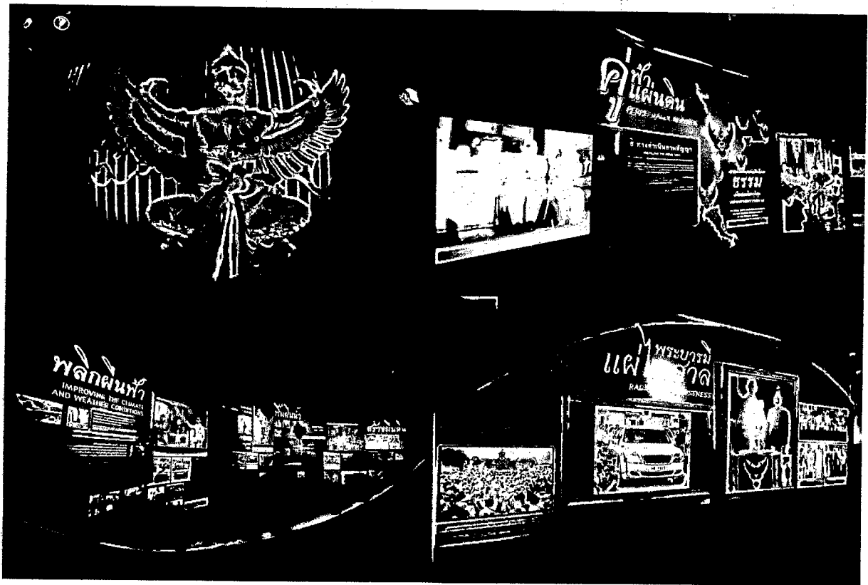
ส่วนจัดแสดงที่ 6 ห้องจัดแสดงครุฑ "ครุฑ" ต้นแบบความซื่อสัตย์ ตราตั้งห้างพระราชทาน