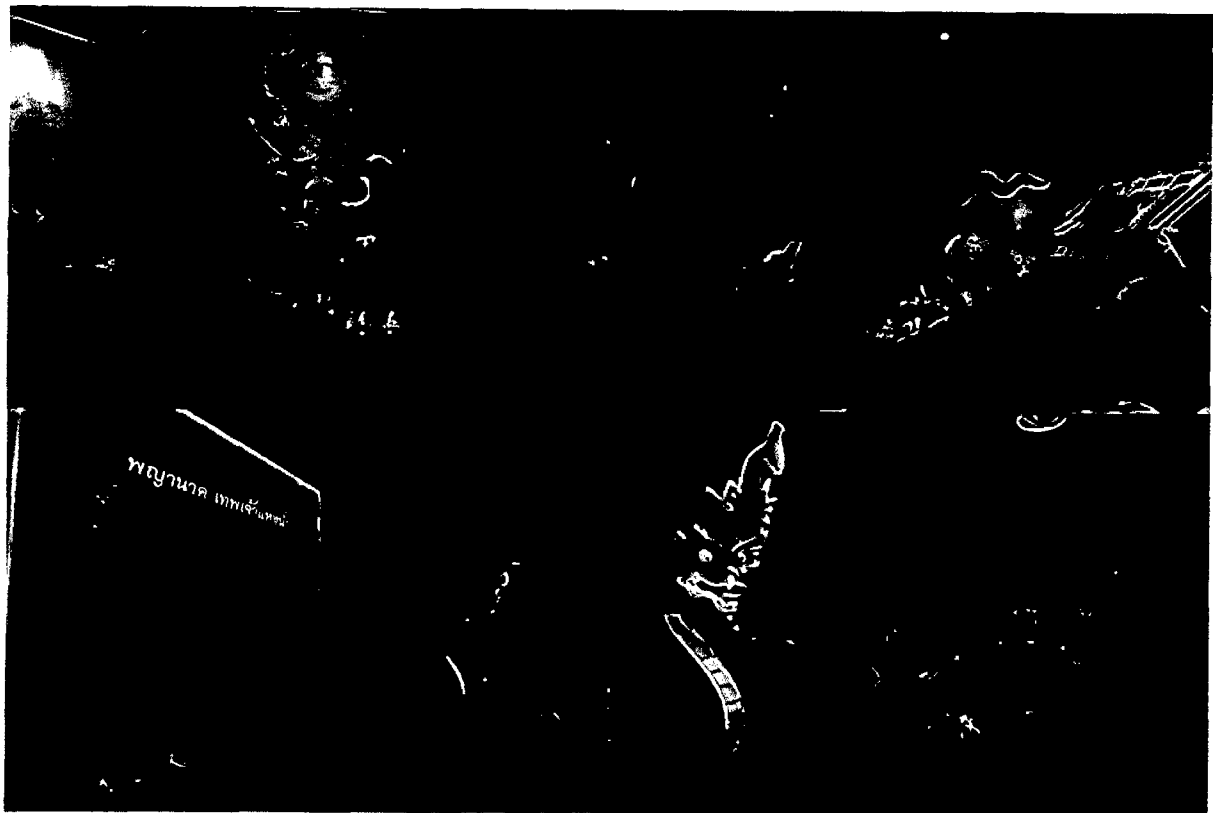
ส่วนจัดแสดงที่ 4 อมตะจ้าวเวหา "ครุฑ" ต้นแบบความดีเป็นที่ประจักษ์